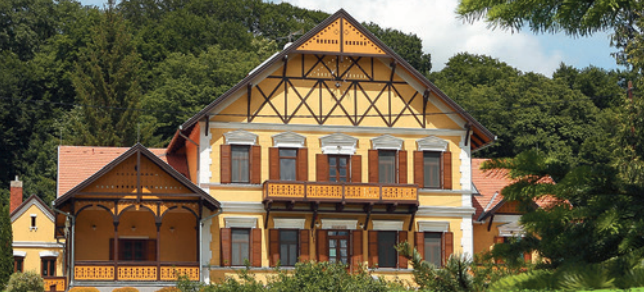
SASRÉT VENDÉGHÁZ | Almamellék, Sasrét-pusztá