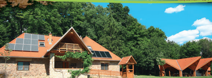
ERDŐ HÁZA | HETVEHELY – SÁS-VÖLGY

Fedezze fel további szálláshelyeinket a Mecsekben és a Zselicben!